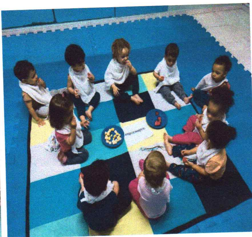
Piquenique nos berçários